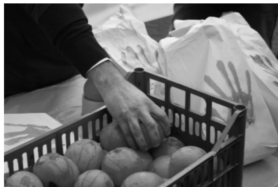
Ancora "arance insanguinate" al Senato