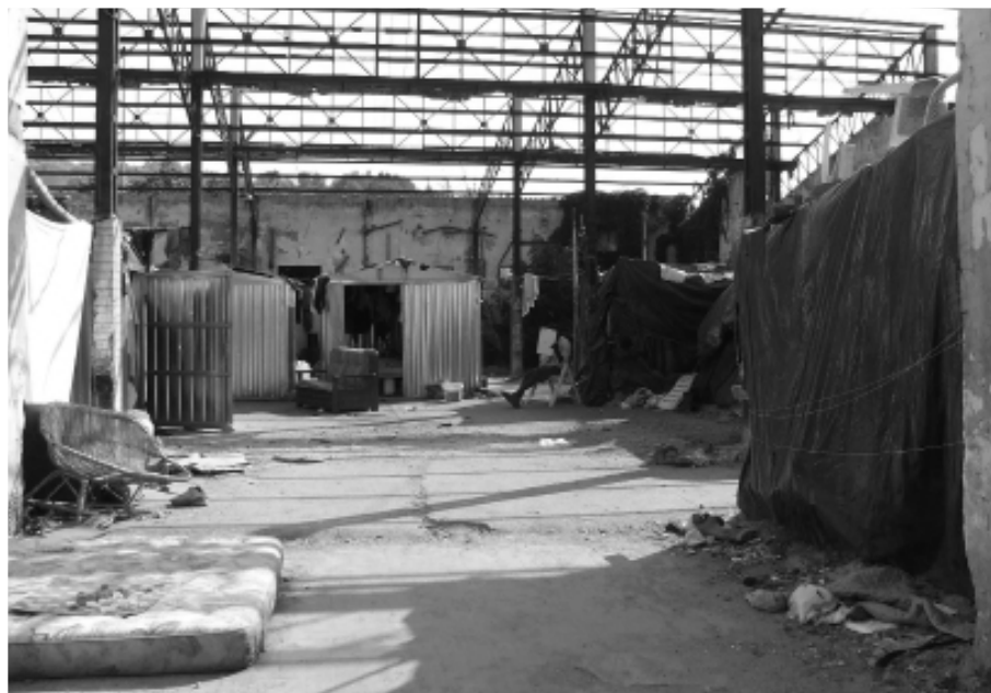
Uno scorcio de La Rognetta, l'ex fabbrica per la produzione delle arance diventata rifugio per centinaia di immigrati