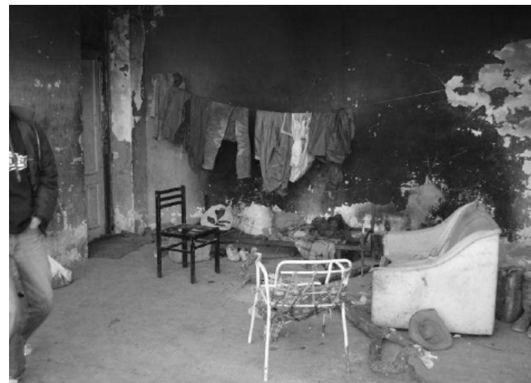
Panni stesi tra sporcizia e degrado. Le prime denunce sulla condizione dei migranti a Rosarno risalgono al 2005