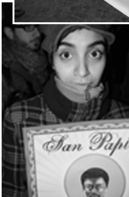
Il 12 gennaio a Piazza Navona, in concomitanza con il discorso del ministro Maroni in Parlamento, daSud e le associazioni antirazziste distribuiscono "arance insanguinate"