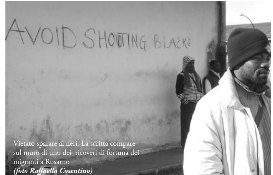
Vietato sparare ai neri. La scritta compare sul muro di uno dei ricoveri di fortuna dei migranti a Rosarno

Oggi nelle nostre tiepide tane superbi e pavidi come sciacalli tra lo schiamazzo della televisione e le solitudini degli avatar ce ne stiamo a ordire inferni per gli altri dietro l’angolo di casa.