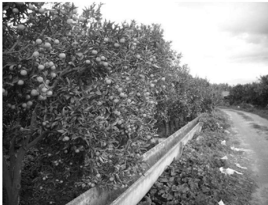
Agrumeto della Piana di Gioia Tauro

Da dicembre a marzo migliaia di immigrati sono impiegati come stagionali nella raccolta delle arance